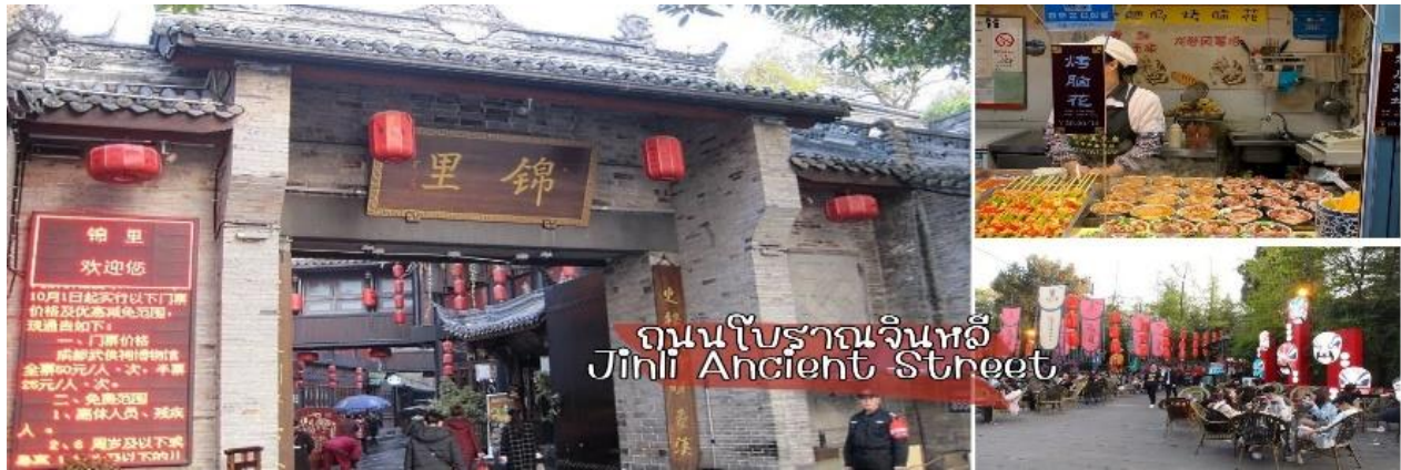
ถนนโบราณจินหลี่ Jinli Ancient Street

นำท่านชม ถนนโบราณจินหลี่ ถนนที่อยู่ติดกับศาลเจ้าสามก๊ก เป็นถนนวัฒนธรรม ตกแต่งแบบย้อนยุค เต็มไปด้วยกลิ่นอายของสามก๊ก ตัวถนนมีการตกแต่งอย่างสวยงาม มีของเก๋ๆ มากมาย มีร้านอาหาร ร้านน้ำชา โรงเตี๊ยม โรงจิว และมีของที่ระลึกเกี่ยวกับสามก๊กขายเยอะมาก ร้านอาหารหลายร้านตกแต่งเป็น เล่าปี กวนอู เตียวหุย มีของกินข้างทางอร่อยๆ